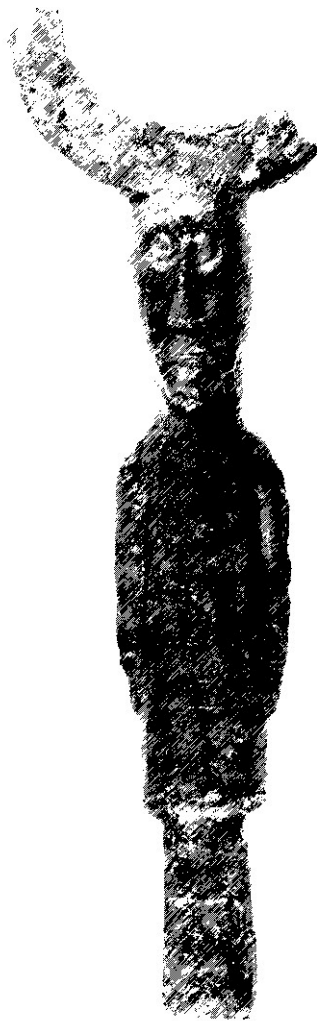
Oden. Fynd från Uppåkra.

Något som också styrker en större forntida bebyggelse i området strax öster om Uppåkra och mycket nära Dalby är kartan med kyrkotätheten som här gör en utlöpare från Bara österut. Tätt samlade ligger här också