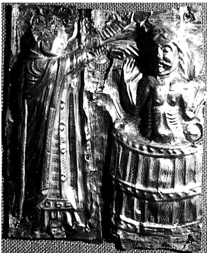
Harald Blåtand döps av den tyske biskopen Poppo. Delar av ett altare från Tamdrups kyrka.

Harald Blåtand framstår som den store riksdanaren. Från sitt huvudsäte i Jelling i Jylland härskade han över hela Danmark. Det är också kungen som anlägger en mängd stora borgar runt om i sitt rike. Han inför också kristendomen, vilket givetvis