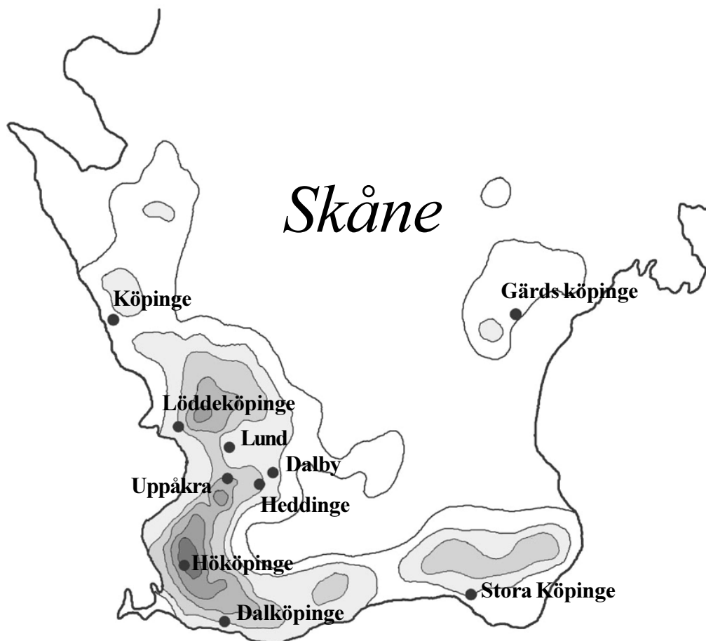
Kyrkotäthetskarta med speciella orter som omtalas i artikeln. Ju mörkare områden desto tätare med medeltida kyrkor. Analys Sven Rosborn.

nordligaste utlöparen i Baras härads kyrkokoncentration ligger Uppåkra. Kanske är det så att Uppåkra som handelsplats bör sammankopplas med just Bara härad, dvs den rika bygden söder om Höje å.